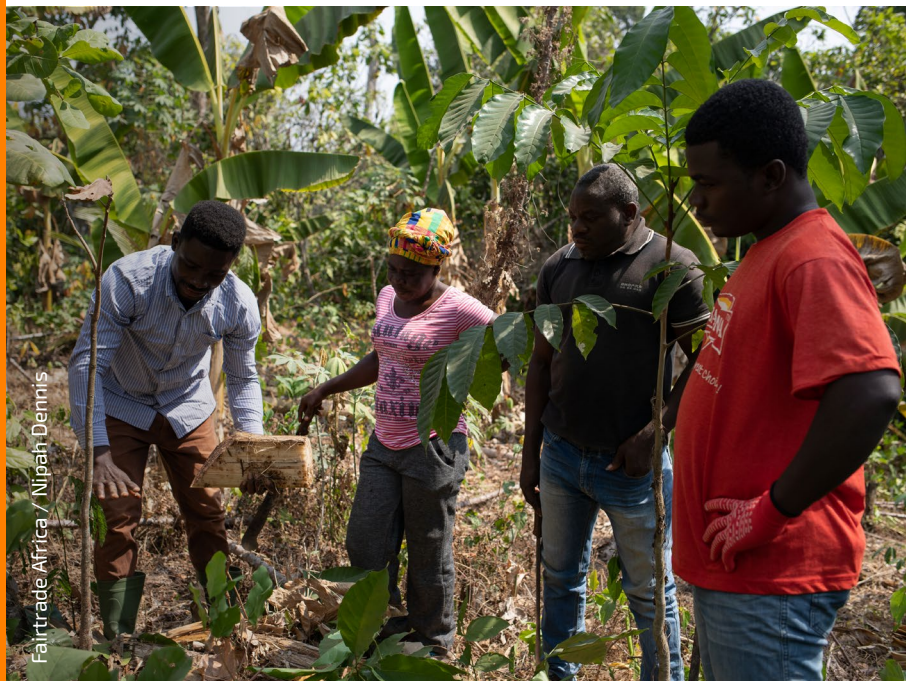
Fairtrade Africa / Nipah Dennis